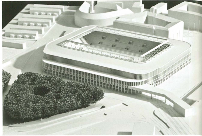
1. Rang: Burkard Meyer Architekten, Baden