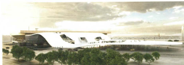
ARGE Snøhetta – Stiefel Kramer Architecture, Oslo, Wien