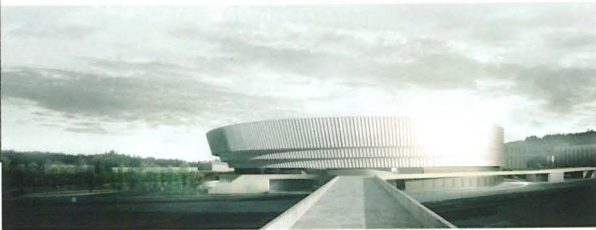
Cruz y Ortiz Arquitectos, Sevilla