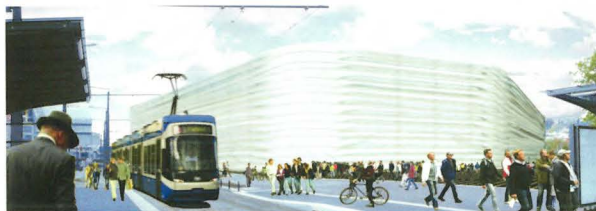
NO.MAD Arquitectos, Madrid