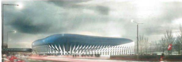
Marques AG, Luzern