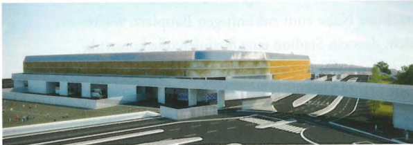
Guilherme Machado Vaz Arquitecto, Porto