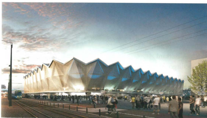
2. Rang: Graber Pulver Architekten, Zürich

In der Wettbewerbsausstellung in der ehemaligen Bananenreiferei des Migros-Verteilzentrums, in nächster Nähe zum zukünftigen Bauplatz, zeigte sich, dass ein Stadion eine faszinierende konstruktive Herausforderung ist, der sich die Entwerfer mit Inbrunst stellten. Nicht alle haben die prekäre städtebauliche Situation ernst genommen. Die markant-dynamische Struktur «Capri» von pool Architekten, das wohl schönste der nicht weiter bearbeiteten Projekte, lässt die industrielle