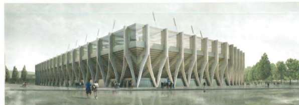
pool Architekten, Zürich