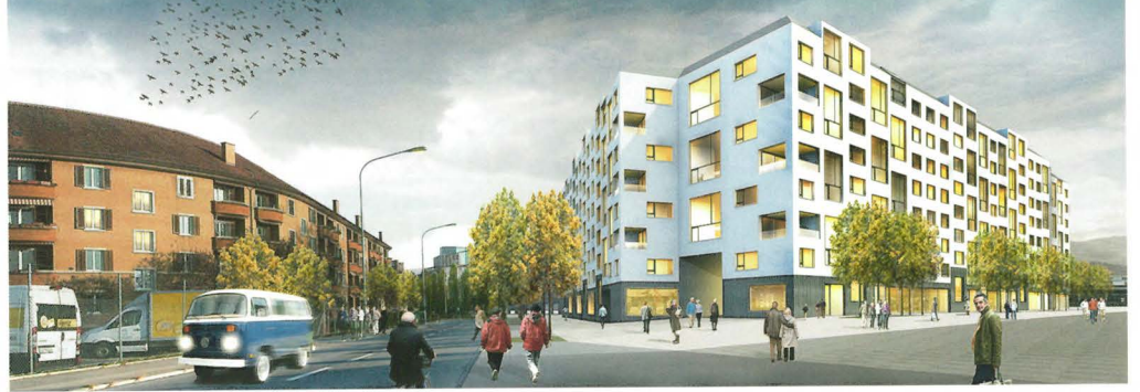
Wohnsiedlung Hardturm, 1. Rang: Bob Gysin + Partner, Zürich